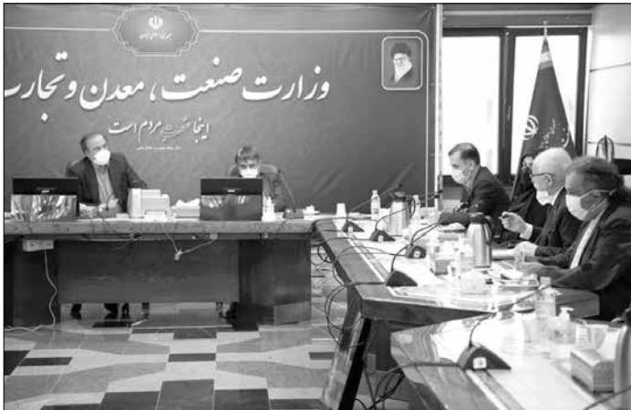
تهیه و تنظیم: مینا بیانی